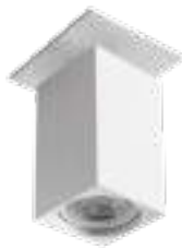
CHIRO GU10 DTL-W