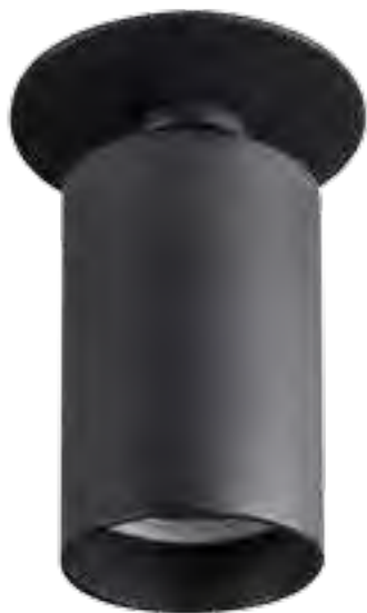
CHIRO GU10 DTL-B