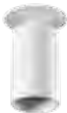
CHIRO GU10 DTO-W