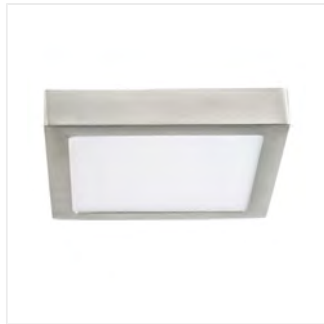
KANTI V2LED 18W-NW-SN