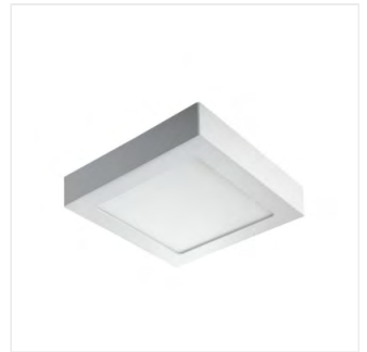
KANTI V2LED 18W-NW-W