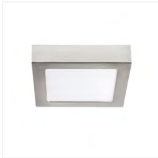
KANTI V2LED 12W-NW-SN