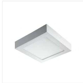
KANTI V2LED 12W-NW-W