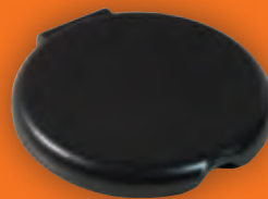
1 – черный