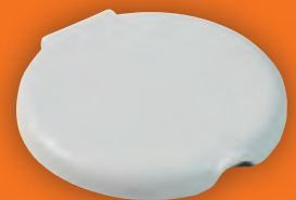
10 – серый