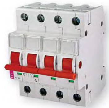
SV 463 ..4125