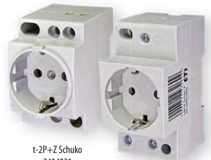
t-2P+Z Schuko 2414021