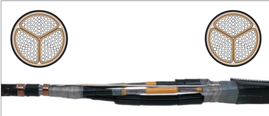
Кабель с экраном для каждой жилы