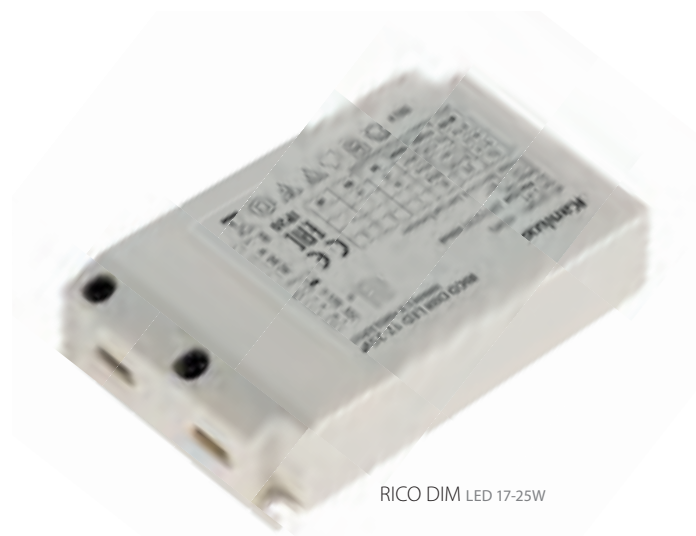
RICO DIM LED 17-25W