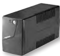
3 103 00