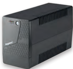
3 103 02

Однофазный ИБП для компьютеров, аудио- и видеоаппаратуры. Полная защита от разряда и перегрузки, короткого замыкания и перегрева. Кнопка питания и светодиодные индикаторы; визуальная и звуковая сигнализация состояния ИБП.