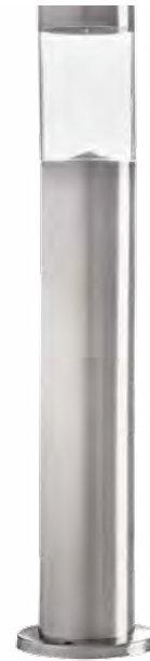
SOBI PV 50