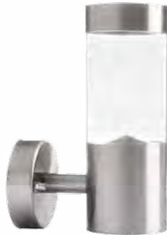
SOBI PV 21