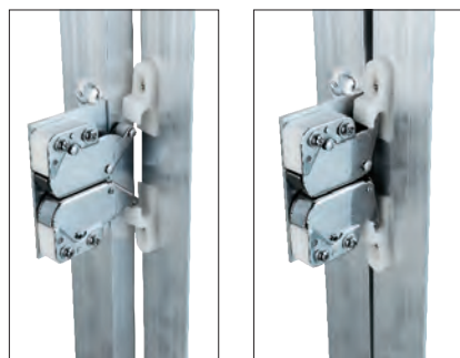
Специальный замок обеспечивает надёжную фиксацию