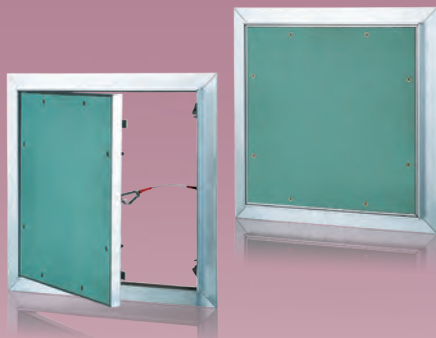
Ревизионные дверцы для монтажа в конструкции из гипсокартона