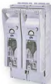
KVL-00 2p M8-M8