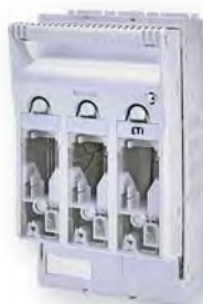
KVL-00 3p M8-M8