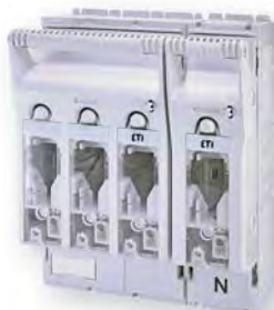
KVL-00 4p M8-M8

Применение - Горизонтальные разъединители KVL предназначены для ввода и распределения электроэнергии, защиты оборудования от перегрузки и токов короткого замыкания в цепях переменного и постоянного тока, с использованием ножевых предохранителей NH. Позволяют безопасно коммутировать электрические цепи под нагрузкой.