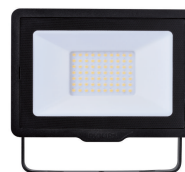
Essential SmartBright G3 LED Floodlight 3