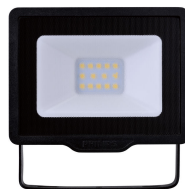
Essential SmartBright G3 LED Floodlight 10W 3