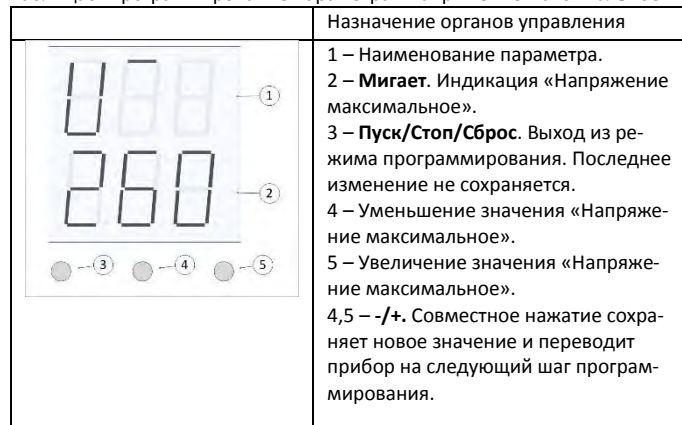
Таблица6. Программирование параметра «Напряжение максимальное».