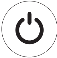
Кнопка ON/OFF для модели AP-100