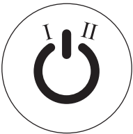
Кнопка ON/Переключение скорости/OFF для модели AP-105