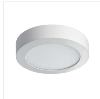
CARSA V2LED 12W-NW-W