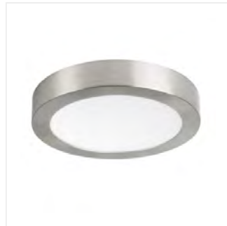
CARSA V2LED 18W-NW-SN