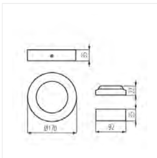
CARSA V2LED 12W