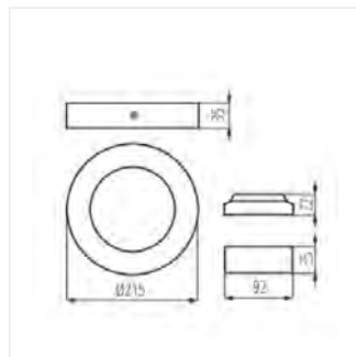
CARSA V2LED 18W