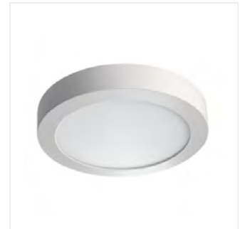
CARSA V2LED 18W-NW-W