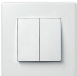
Вимикач двоклавішний (Перемикач прохідний двоклавішний)

PLK0111xx1 + PLK1010xx2 (PLK0211xx1 + PLK1010xx2)