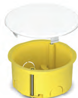
Розподільчий бокс 80x45 для порожніх стін, жовтий PLK6002400