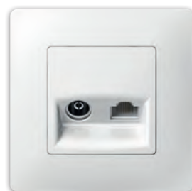
ТВ розетка + комп'ютерна RJ45 PLK0911xx1 + PLK1010xx1