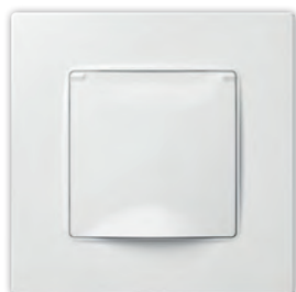
Розетка з кришкою з заземленням без захисної шторки (або з захисною шторкою)

PLK0541xx1+PLK1010xx2 (PLK0551xx1+PLK1010xx2)