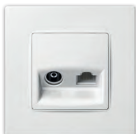
ТВ розетка + комп'ютерна RJ45