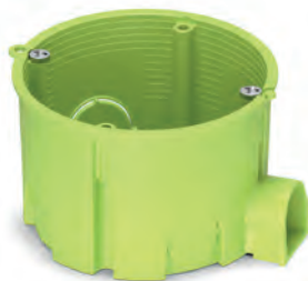
MB001 - бокс монтажний 65x45 для суцільних стін, салатовий PLK5001500