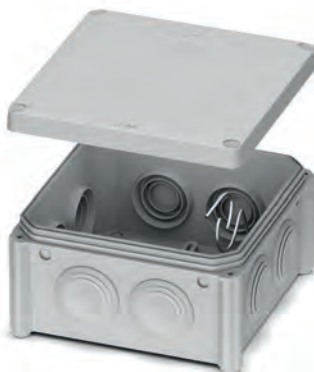
Розподільчий бокс IP55 - 100x100x50 відкритого монтажу PLK6506650