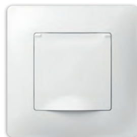
Розетка з кришкою з заземленням без захисної шторки (або з захисною шторкою) PLK0541xx1 + PLK1010xx1 (PLK0551xx1 + PLK1010xx1)