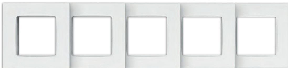
Рамка одномісна, двохмісна, трьохмісна, чотирьохмісна, п'ятимісна, серія NORDIC

PLK1010xx2, PLK1020xx2, PLK1030xx2, PLK1040xx2, PLK1050xx2