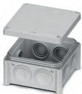
Розподільчий бокс IP55 - 85x85x40 відкритого монтажу PLK6505650