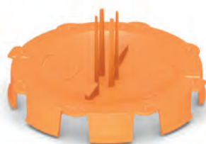
Кришка для монтажного боксу для штукатурки, помаранчева D65 PLK4902480