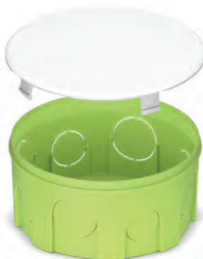
Розподільчий бокс 100x50 для суцільних стін, салатовий PLK6103500