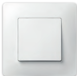
Перемикач прохідний одноклавішний (Кнопка-вимикач без фіксації, одноклавішна) PLK0211xx1 + PLK1010xx1 (PLK0411xx1 + PLK1010xx1)