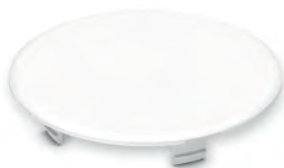
Кришка для монтажного боксу гладка, біла D65 PLK4901490