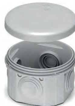
Розподільчий бокс IP55 - 80x40 відкритого монтажу PLK6404650