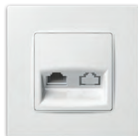
Комп'ютерна розетка одинарна

PLK0541xx1+PLK1010xx2 (PLK0551xx1+PLK1010xx2)