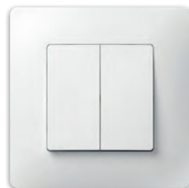
Перемикач прохідний двохклавішний PLK0221xx1 + PLK1010xx1