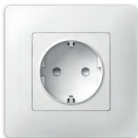
Розетка з заземленням з захисною шторкою PLK0521xx1 + PLK1010xx1