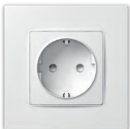
Розетка з заземленням з захисною шторкою