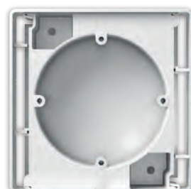
Коробка накладного монтажу набірна, серія NORDIC