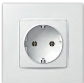
Розетка з заземленням без захисної шторки