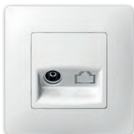
ТВ розетка крайова одинарна PLK0811xx1 + PLK1010xx1