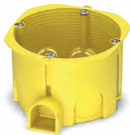
MB002 - бокс монтажний 65x45 для порожніх стін, жовтий PLK4002400