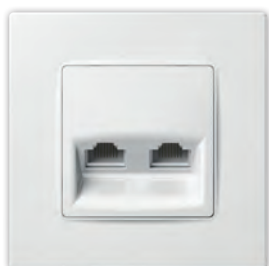
Комп'ютерна розетка подвійна