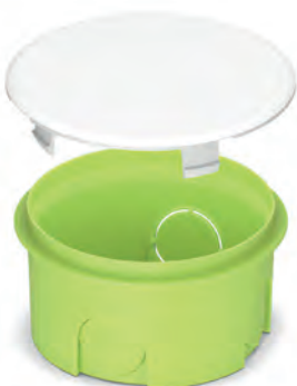
Розподільчий бокс 70x40 для суцільних стін, салатовий PLK6101500