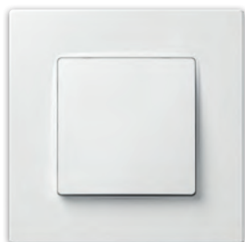
Вимикач одноклавішний (Перемикач прохідний одноклавішний)

PLK0111xx1 + PLK1010xx2 (PLK0211xx1 + PLK1010xx2)