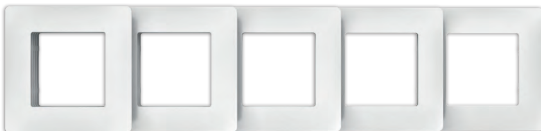
Рамка одномісна, двохмісна, трьохмісна, чотирьохмісна, п'ятимісна, серія CLASSIC PLK1010xx1, PLK1020xx1, PLK1030xx1, PLK1040xx1, PLK1050xx1

* де xx – це колір: 03 - білий; 13 - слонова кістка; 24 - антрацит