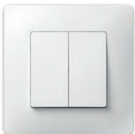
Вимикач двохклавішний PLK0121xx1 + PLK1010xx1