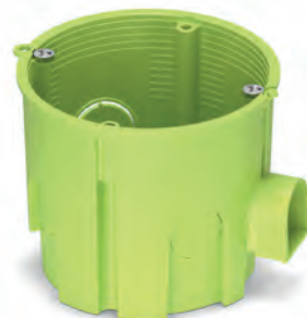
MB003 - бокс монтажний глибокий 65x60, для суцільних стін, салатовий PLK5103500