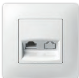
Комп'ютерна розетка одинарна PLK0731xx1 + PLK1010xx1