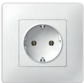
Розетка з заземленням без захисної шторки PLK0511xx1 + PLK1010xx1