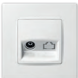
ТВ розетка крайова одинарна