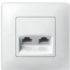
Комп'ютерна розетка подвійна PLK0741xx1 + PLK1010xx1