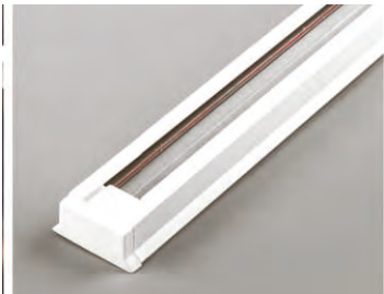
Однофазний шинопровід CAB1000