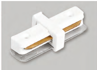
Конектор прямиий LD1000

Комплектація: шинопровід, заглушка, закрушка з клеюю, комплект кріплень.