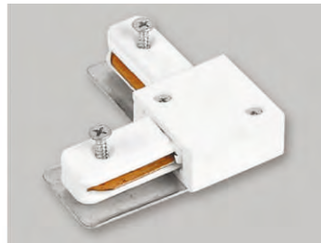
Конектор кутовий LD1001