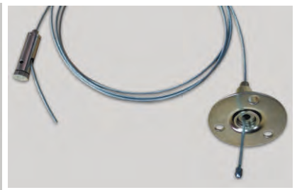
Тросовий підвіс LD1002