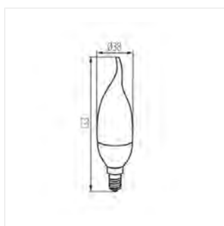
IDO 6,5W T SMD E14