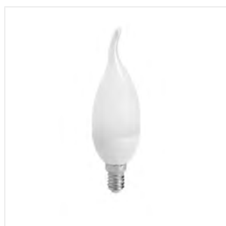
IDO 6,5W T SMD E14