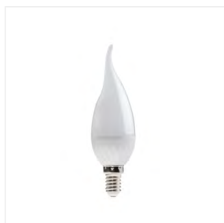
IDO 4,5W T SMD E14