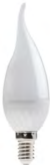
IDO 4,5W T SMD E14