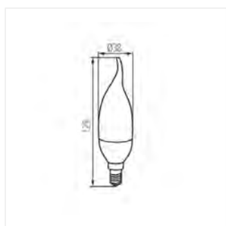
IDO 4,5W T SMD E14