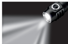
Режим максимальной мощности.