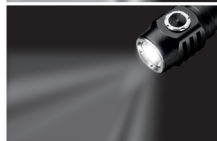
Режим минимальной мощности.