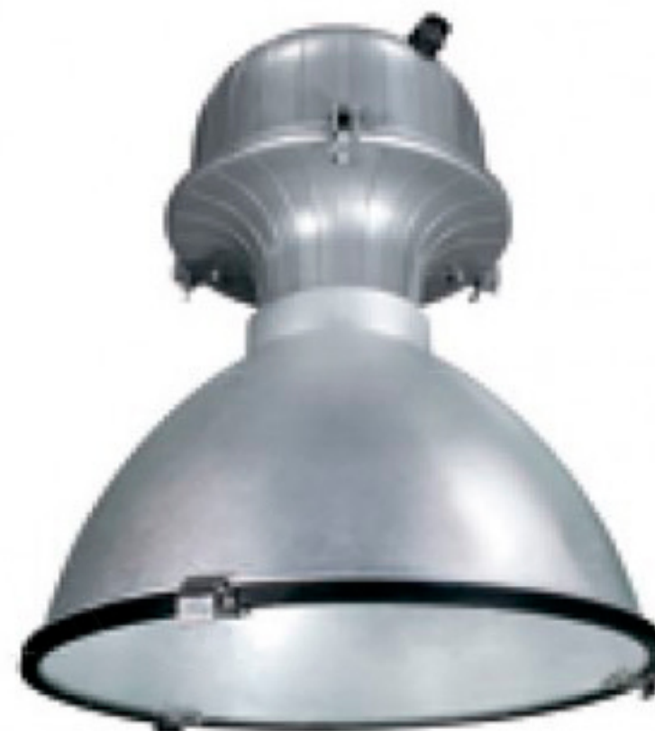
EURO MTH AL