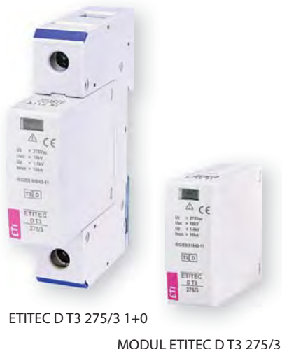
ETITEC D T3 275/3 1+0