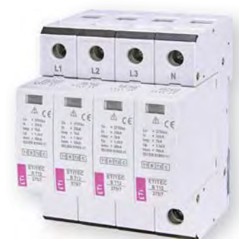
ETITEC В Т12 275/7 4+0