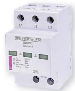
ETITEC T WENT 320/12,5 3+0