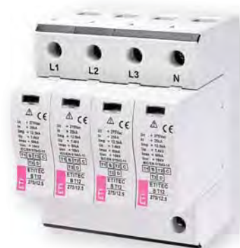
ETITEC В Т12 275/12,5 4+0

Применение - Ограничители перенапряжения ETITEC В Т12 предназначены для установки внутри объектов (зданий). Защита от перенапряжений группы ETITEC В Т12, в соответствии с VDE стандартом, обозначается как класс В, С, D. Согласно стандарту IEC обозначается как категория I, II, III и EN тип 1, тип 2, тип 3.