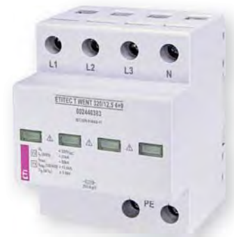
ETITEC T WENT 320/12,5 4+0