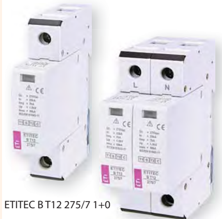
ETITEC В Т12 275/7 1+0