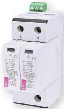
ETITEC В Т12 275/12,5 2+0 RC