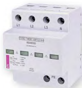
ETITEC T WENT 320/12,5 4+0