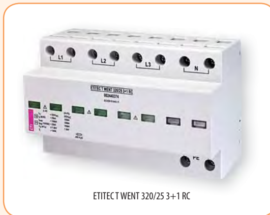
ETITEC T WENT 320/25 3+1 RC

RC - сигнальный контакт повреждения варисторного элемента I n /I max - указано на один полюс