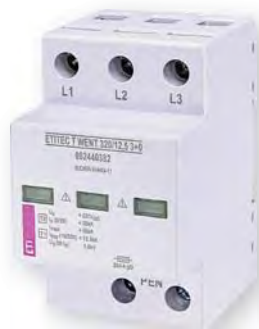
ETITEC T WENT 320/12,5 3+0