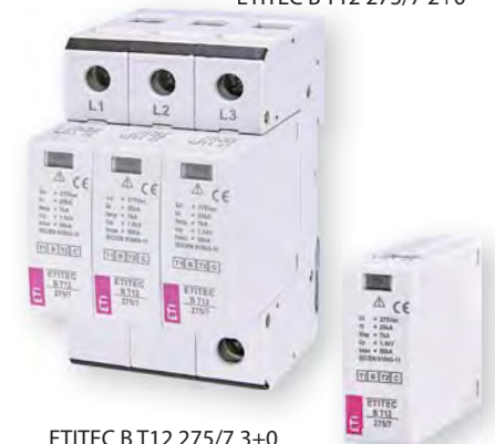
ETITEC В Т12 275/7 3+0