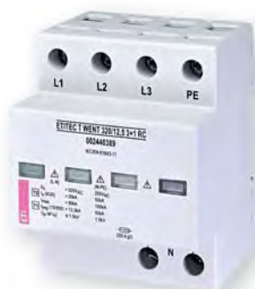
ETITEC T WENT 320/12,5 3+1 RC