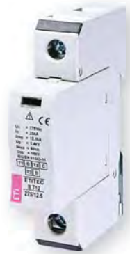
ETITEC В Т12 275/12,5 1+0