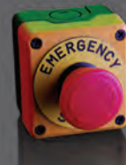
Таблица выбора пультов управления пластмассовые серии PV PV Series Plastic Control Boxes Selection Table